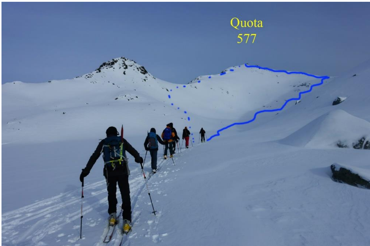
Parte alta itinerario