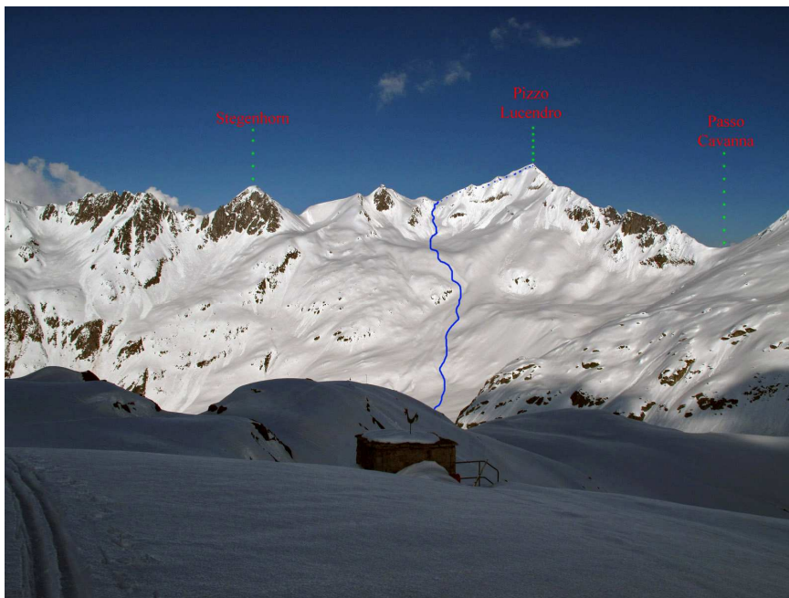
Salita al Pizzo Lucendro visto dalla Rotondohütte

Il Massiccio del San Gottardo (detto anche Catena Rotondo-Centrale-Piz Blas è un gruppo montuoso delle Alpi, appartenente alla sezione delle Alpi Lepontine. Si trova in Svizzera, alla congiunzione dei cantoni Vallese, Uri, Grigioni e Ticino. Prende il nome dal Passo del San Gottardo, posto al centro del massiccio.